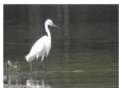
นกยางเปี้ย ( Egretta garzetta )

รูปที่ ง-2 ตัวอย่างสัตว์ป่าที่พบในพื้นที่ (ต่อ)