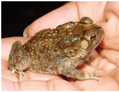
คางคกบ้าน ( Duttaphrynus elanostictus )