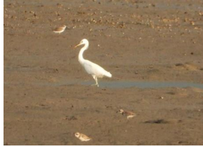
นกยางจีน ( Egretta eulophotes )