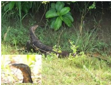
เหี้ย ( Varanus salvator )