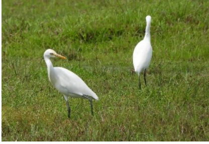
นกยางโทนน้อย ( Ardea intermedia )