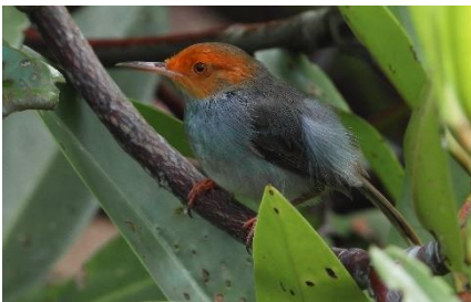
นกกระजิบกระหม่อมแดง ( Orthotomus sericeus )