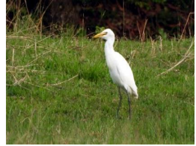
นกยางควาย ( Bubulcus coromandus )