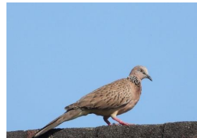
นกเขาใหญ่ ( Streptopelia chinensis )