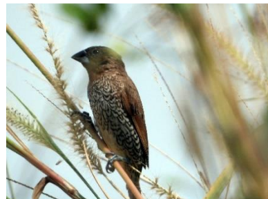
นกกระดัดข้า้หมู ( Lonchura punctulata )