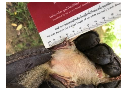
รูปที่ ง-3 ภาพการทำงานในพื้นที่