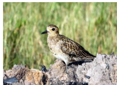
นกหัวโตหลังจุดสีทอง ( Pluvialis fulva )