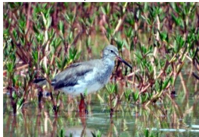
นกทะเลขาแดงธรรมดา ( Tringa totanus )