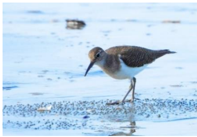
นกเด้าดิน ( Actitis hypoleucos )