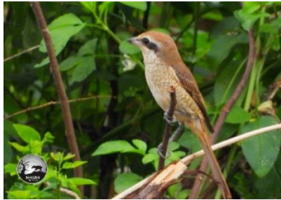
นกอีเสือสีน้ำตาล ( Lanius cristatus )