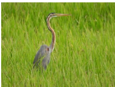
นกกระสาแดง ( Ardea purpurea )