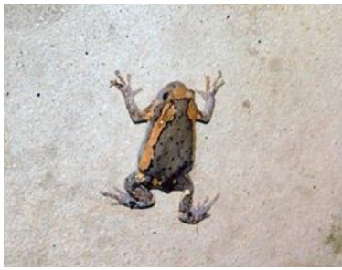
อีงอ่างบ้าน ( Kaloula pulchra )