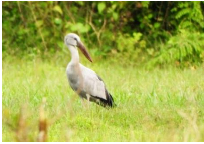
นกปากห่าง ( Anastomus oscitans )