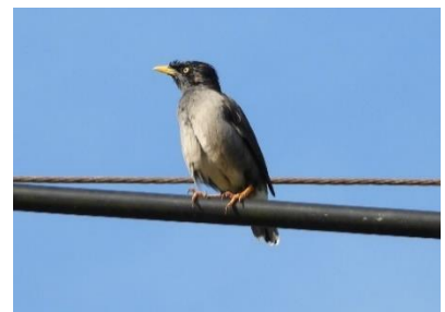
นกเอี้ยงควาย ( Acridotheres fuscus )