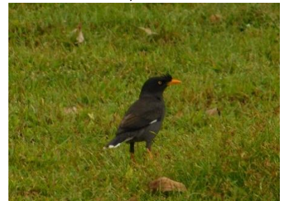
นกเอี้ยงหงอน ( Acridotheres gradis )

รูปที่ ง-2 ตัวอย่างสัตว์ป่าที่พบในพื้นที่ (ต่อ)