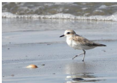
นกหัวโตหน้าขาว ( Charadrius dealbatus )