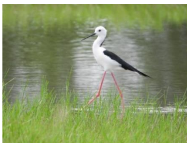
นกตีนเทียน ( Himantopus himantopus )