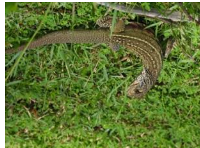
แย้ใต้ ( Leiolepis belliana belliana )