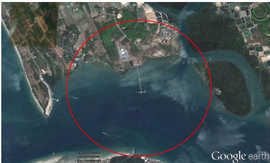
รูปที่ ง-1 พื้นที่สำรวจทรัพยากรสัตว์ป่าโดยรอบพื้นที่ท่าเทียบเรือ