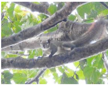
กระรอกหลากสี ( Callosciurus finlaysonii )