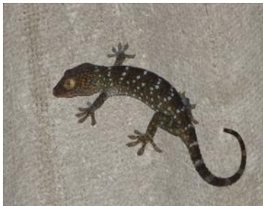
ตุ๊กแกบ้าน ( Gekko gecko )