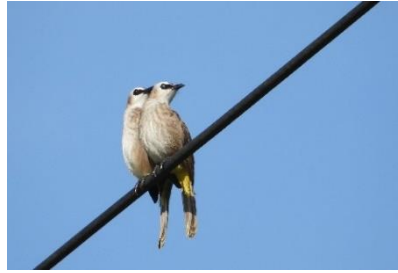
นกปรอดหน้านวล ( Pycnonotus goiavier )