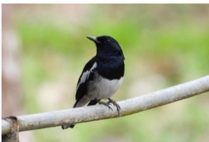
นกกาขเหนบ้าน ( Copsychus saularis )