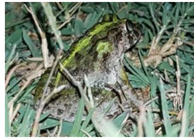
กบหนอง ( Fejervarya limnocharis )