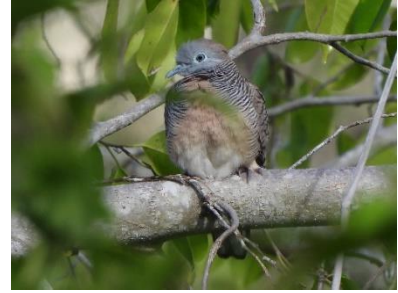
นกเขาชวา ( Geopelia striata )