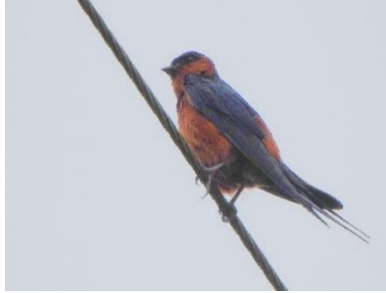
นกนางแอ่นตะโพกแดง ( Cecropis daurica )