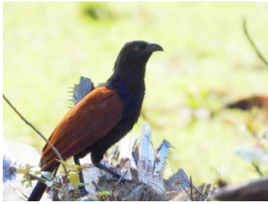
นกกะปูดใหญ่ ( Centropus sinensis )