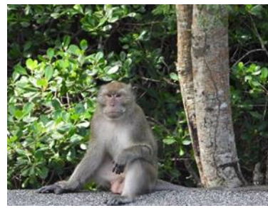
ลิงแสม ( Macaca fascicularis )