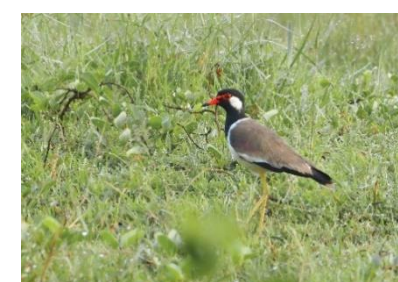
นกกระแตแต้แว๊ด ( Vanellus indicus )