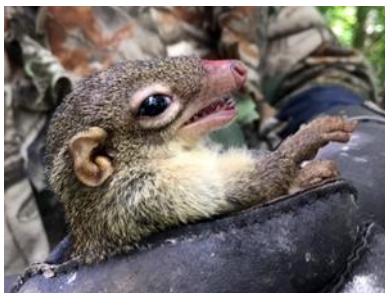
กระแตป่าใต้ ( Tupaia glis )